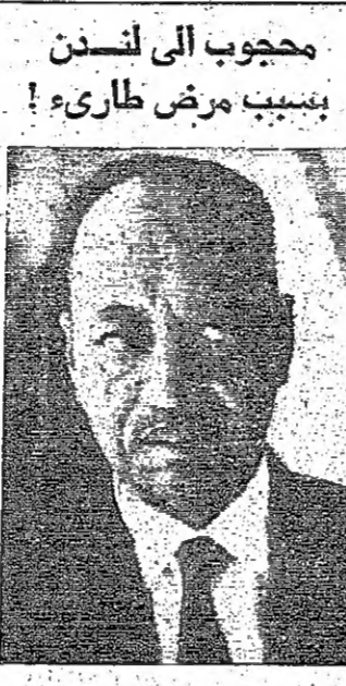
محبوب الى لندن بسبب مرض طارئ !

أذا فشل أيضا ويكمن هؤلاء الدبلوماسيون بسان الدكتور بارينغ قد يتخلى عن مهمته ويعود الى منصبه كسفير للسويد في موسكو اذا هو فشل في تحقيق تفهم هذه المرة . الطريق المسدود وكان قرار الدكتور بارينغ العودة الى مقره في نيقوسيا عاصمة قبرص قد أعلن هنا أمس الأول بعد ان اضي حوالي ستة أسابيع في نيويورك دون ان يخرز اي تقدم في مهمته او يخرج من الطريق المسدود الذي وصلت اليه هذه المهمة . وقد عقد محادثات خلال وجوده هنا مع وزراء خارجية الجمهورية العربية المتحدة والاردن واسرائيل . مقابلات جديدة وعاد الوزراء الثلاثة الى عواصم بلدانهم بعد ان انتهى كل من المانحين الثلاثة على الجانب الاخر في فصل مساعي السلام . وسيستمر ايا ايمان وزير خارجية اسرائيل الى نيقوسيا في الاسبوع القادم لاستئناف المحادثات مع الدكتور بارينغ . ويتنظر ان يقوم بارينغ في وقت لاحق بزيارة القاهرة للاجتماع الى السيد محمود رياض وزير الخارجية المصرية ثم يزور عمان لزيارة السيد عبد القوم الرفاعي وزير الخارجية الاردنية . لا تفاؤل وقد سبق لكل من السيد رياض والسيد الرفاعي ان وعدا بالتعاون مع الدكتور بارينغ غير ان مصادر عربية البقية على صفحته ٦ عمود ٤